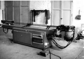
Dorn - Biegemaschine BLM