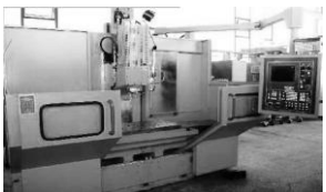
Universal-Fräsmaschine Heller BZV 07 / 4000