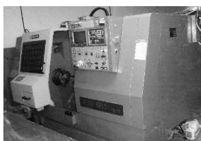
CNC-Drehbank Mori - Seiki SL 25