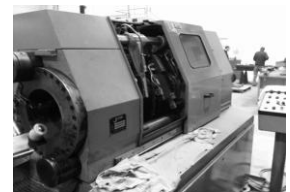
Rohr - Umformmaschine