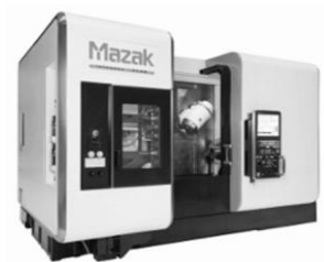
MAZAK Integrex i200 S U 1000