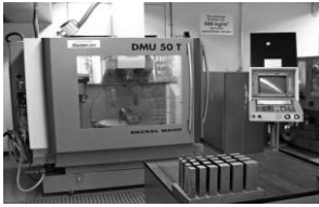
Universal-Fräsmaschine DMU 50T_2