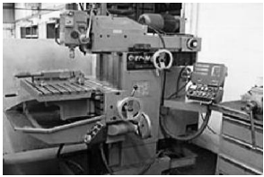
Universal-Fräsmaschine Deckel FP4 M