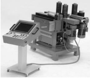
3 Rollen - Biegemaschinen