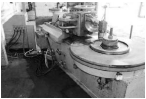
Schablonen - Biegemaschinen