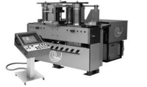
3 Rollen - Biegemaschinen