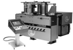
3 Rollen - Biegemaschinen