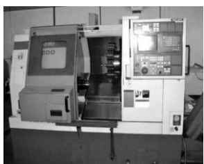
CNC-Drehmaschine mit Dialogst. und autom. Stangenmagazin